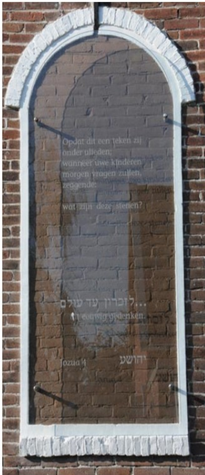
- de herinnering levend houden -